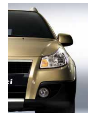
984 Песочный металлик