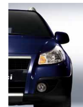
979 Синий металлик