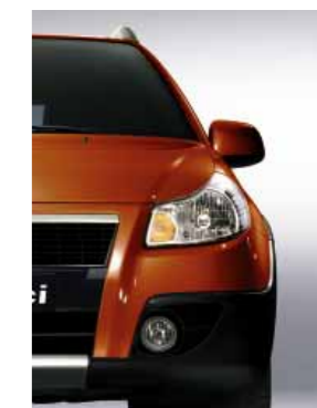
985 Красный металлик