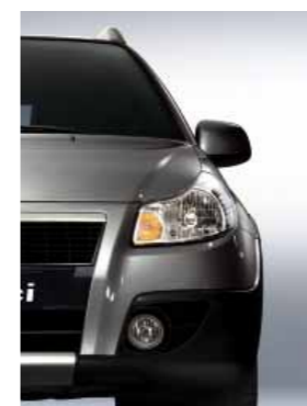
976 Серый металлик