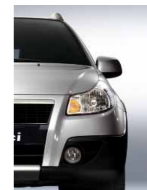
977 Серебристый металлик