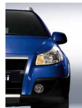
980 Голубой металлик