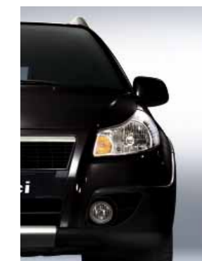
975 Черный металлик